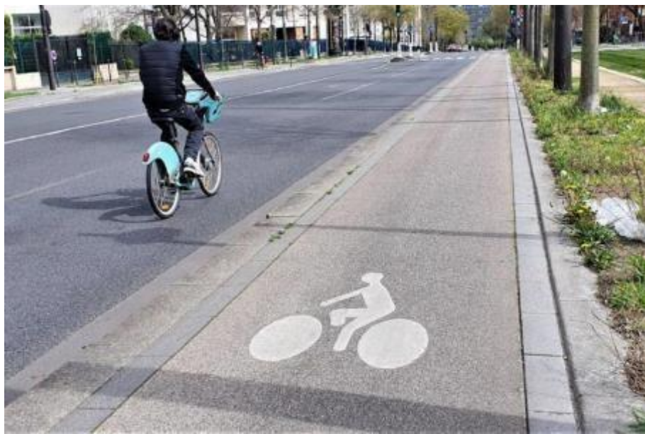
Piste Cyclable

En effet, on peut améliorer l'aménagement d'une piste cyclable en l'entourant de plots, poteaux, barrières ou séparation en béton pour l'isoler davantage. D'autres collectivités entreprennent un revêtement coloré, afin de les remarquer plus facilement. En plus des panneaux M12 (cédez le passage), des feux cyclistes peuvent compléter le dispositif.